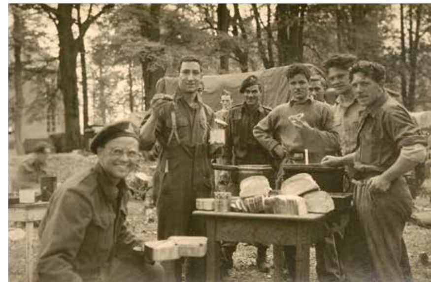
Afb. 4 Canadese soldaten poserend rond een tafel, met op de achtergrond kasteel Oud-Poelgeest.

ben ik daar getuige geweest van zo'n geëxalteerde vrijpartij in het riet waar het te drassig was om tenten op te zetten", waarna de vrijpartij kleurrijk wordt beschreven. Andere berichten laten zien dat dit geen artistieke inkleuring van de werkelijkheid is, zoals een zedenpreek in De Burcht van 23 juni 1945 onder de titel "De houding van onze meisjes". De meisjes worden zelfs vermeld in het War Diary van de 57 Battery, 1 A/Tk Regt, waarin op 14 mei staat genoteerd: "This Bty [Battery] never had such hospitality as now, with pre-war liquor, fine homes and friendly young females. Curfew rather curtails the activities but it is hoped that this will soon be lifted." (Vertaling: "Deze batterij heeft niet eerder zulke gastvrijheid gehad, met vooroorlogse drank, goed onderdak en vriendelijke jongedames. De activiteiten worden nogal beperkt door de avondklok, maar we hopen dat die snel zal worden opgeheven") Een van de foto's geeft een goed beeld van wat er aan metaalvondsten van het Canadese kampement kan worden aangetroffen (afb. 4). We zien zes man poserend rond een tafel met eten en nog enkele personen in de achtergrond. Diverse metalen voorwerpen zijn duidel-