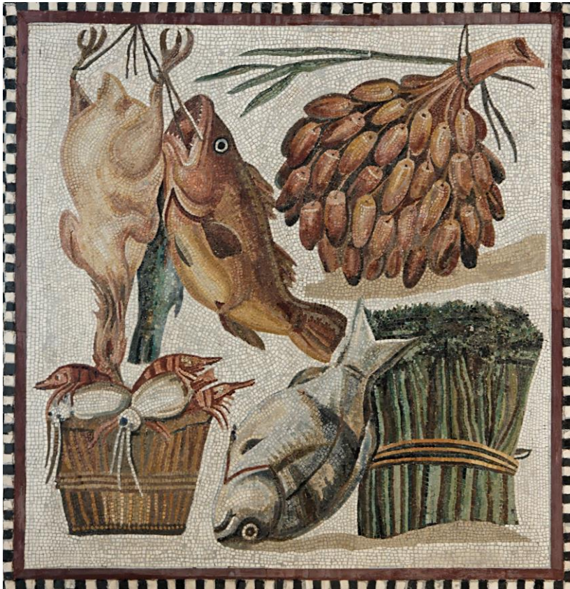
Afb. 5 Vis en groenten, mozaïek in villa Tor Marancia, Rome, 2 e eeuw, Vaticaanse Museum

Komt goed uit, want ik houd van vis. De grond is er erg vruchtbaar. Ik verbouw er tarwe, spelt, gierst, olijven en druiven voor mijn Falernische wijn. Een echte aanrader!