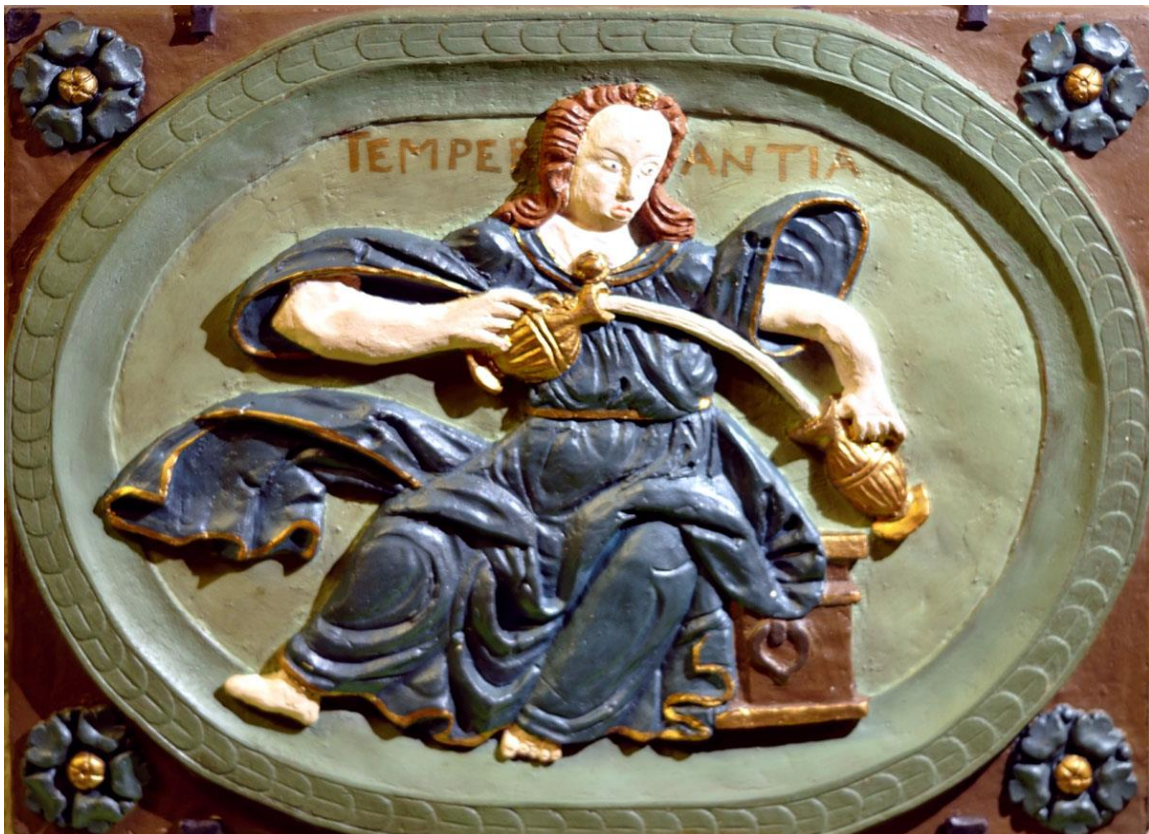
Afb.4 Temperantia , houtsnijwerk Alte Rathaus, Wiesbaden, 1608

Kijk eens hoe de natuur zich aan regels houdt, in de maat loopt en in balans blijft. Doe evenzo, want dan houdt ook u het juiste midden ( temperantia ). Dat dringt des te meer als het om hebzucht, genotzucht, heerszucht en eerzucht gaat. Maat houden bewerkstelligt ook dat je baas over jezelf blijft, je laat je dan niet meer meeslepen door meer-en-meer. Een goede deugd, die matigheid.