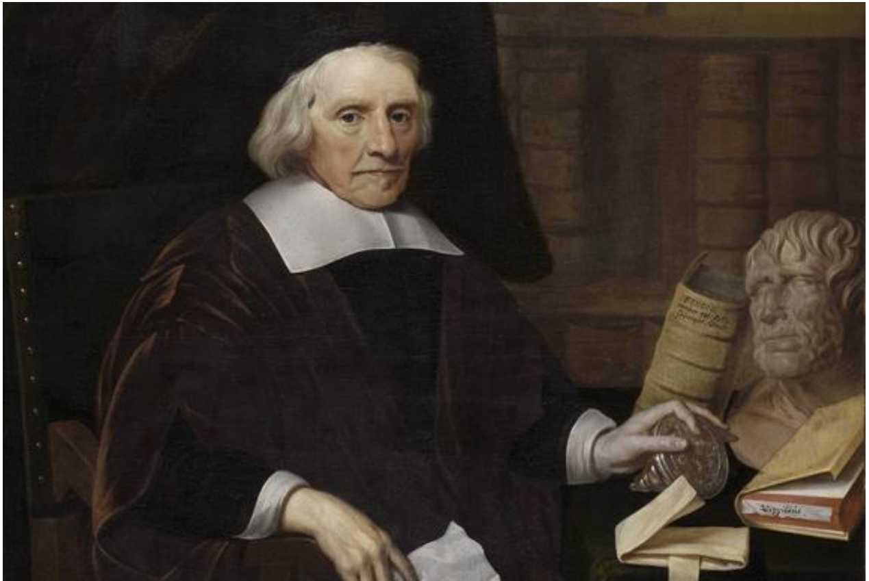
Jacob Cats op 82- jarige leeftijd, in 1660 geschilderd door Arnold van Ravesteyn. Op de tafel een buste van Seneca, 1660.

die twee als zijn leermeesters zag, maakte hij zichtbaar door op een schilderij behalve zichzelf ook een buste van Seneca af te laten beelden. En aan de onderkant van het boek, vlak er tegenaan schreef hij 'Vergilius'.